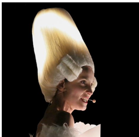
GFP- Portrait "Vocalisez-Moi" (2018)