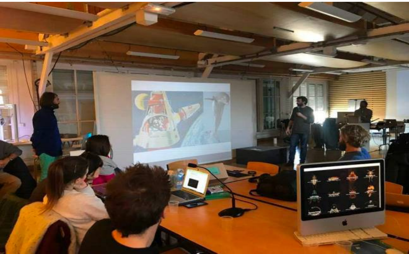
workshop 2019 à l'Ensci

Introduction à la biodiversité, aux science du vivant- Biomatériaux, définition- Cycles d'observation- Enjeux environnementaux et climatiques- Philosophie environnement- Anthropologie et ethnobiologie- Low tech- Histoire naturelle et biomimétisme- Sémantique- Produit, service, espace bio-inspirés- Base de données- Workshops- Droit- Ethique- Déontologie- Modèles économiques- Communiquer le biomimétisme- Atelier mémoire