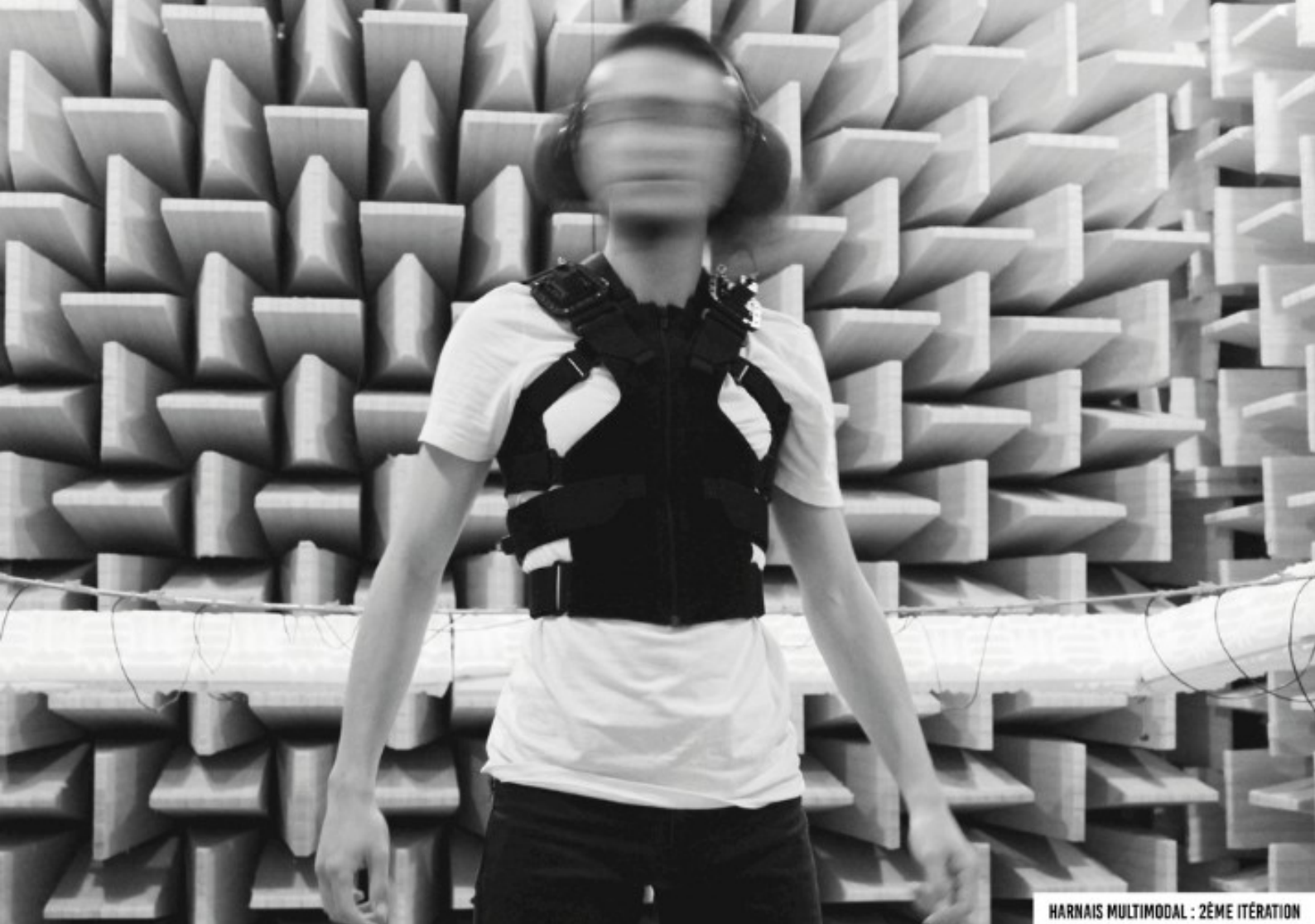
Projet Claire Richards, Insound, harnais multimodal sensoriel