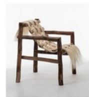
Si(s)tème Fabrice PÉYROLLES