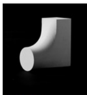
Le préobjet Théa BRION