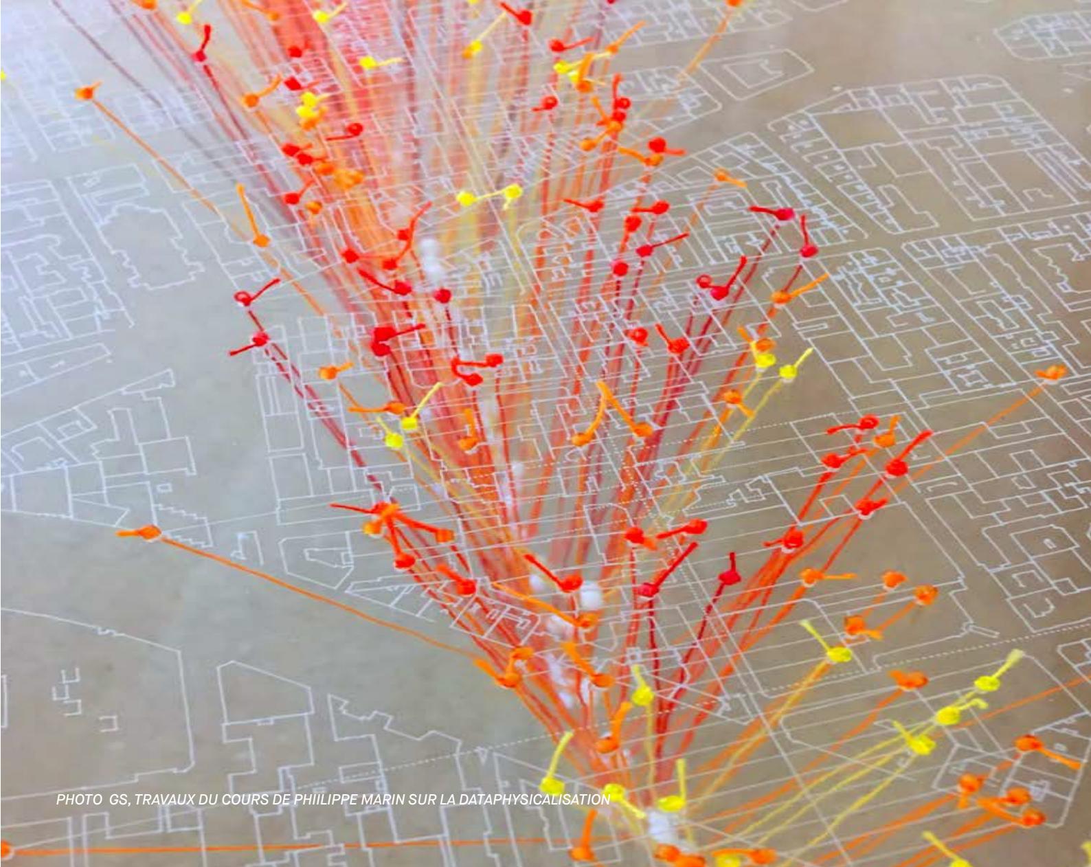
PHOTO GS, TRAVAUX DU COURS DE PHILIPPE MARIN SUR LA DATAPHYSICALISATION